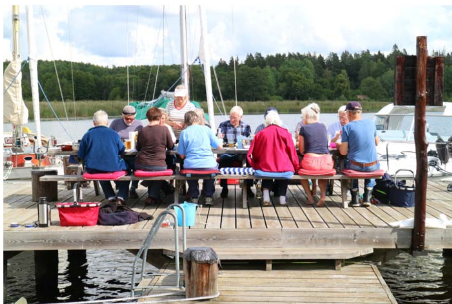
Höststädningens silllunch avnjöts i bästa augustiväder